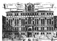
Conservatorio B. Marcello - Venezia